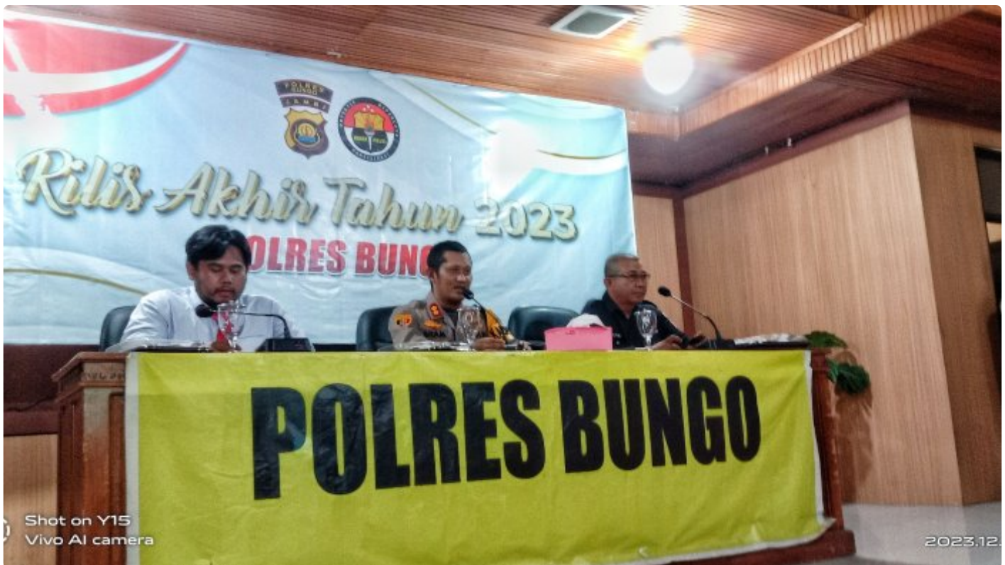
Kapolres Bungo, Kasat Resnarkoba, Humas Polres Bungo

BUNGO - Kapolres Bungo merilis data lahir kinerja tahun 2023 pada (30/12/23), bertempat di lantai 2 aula polres Bungo.